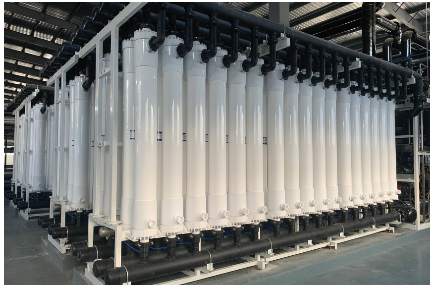
図1: 廃水処理施設で活躍する東レUF HFUG-2020AN